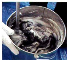
攪拌開始から1分弱の状態