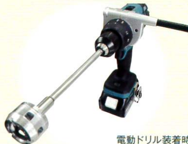
電動ドリル装着時

「エスパイラ」は、市販の電動ドリル・ドライバーに装着可能 ※ です。操作に特別な技術は必要なく、十分に満足できる攪拌成果を得られます。また使用後は、装着のまま溶剤に入れ、作動させることで洗浄可能です。