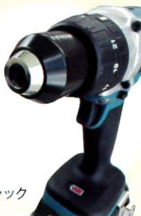
取り付けチャック